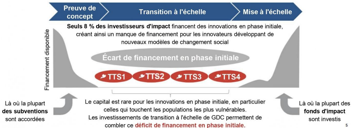
Figure 2b : Cadre de transition à l'échelle de Grands Défis Canada

La mise à l'échelle des innovations en santé mondiale, en aide humanitaire ou au sein des communautés autochtones repose sur la capacité à surmonter le déséquilibre persistant entre le capital d'investissement disponible et les réalités économiques de la création d'entreprises desservant des communautés sous-financées .